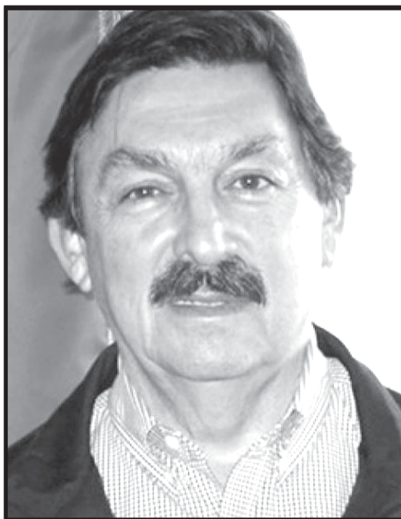
‘Napito’ se robó 55 millones de dólares que correspondían al pago de indemnizaciones de miles de mineros.

al arribar a la sede del Congreso, dijo que ‘acabaría con la corrupción’, palabras que, en boca de este líder ladrón, son una ofensa al pueblo mexicano.