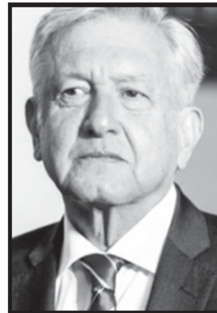
La escena del rebaño del pastor de Macuspana es una parodia del flautista de Hamelín.