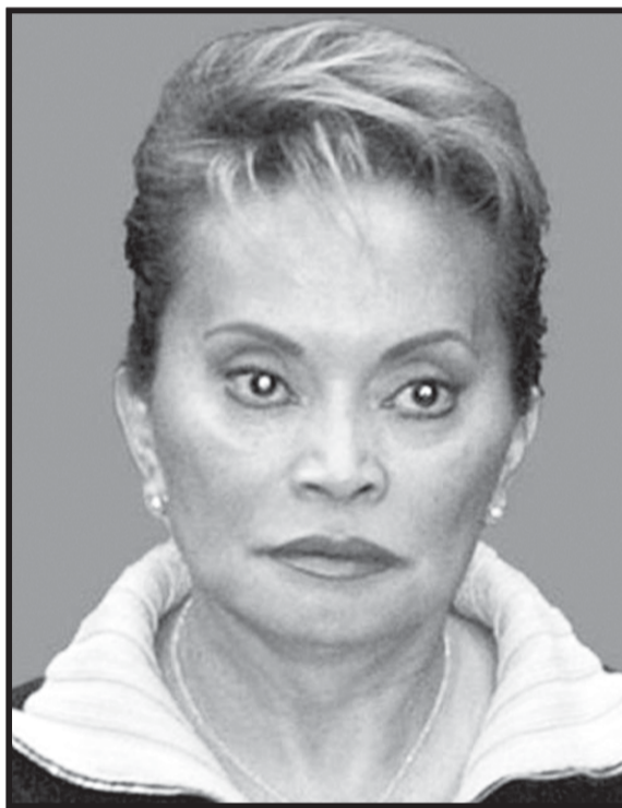
Elba Esther Gordillo está acusada de robarse cientos de millones de pesos de los maestros mexicanos.

Elba Esther tomará venganza de los que ella considera la traicionaron, entre ellos Enrique Peña Nieto y ‘Napito’ a buscar otros millones de dólares para acrecentar su ya de por sí escandalosa riqueza. Hoy más que nunca que retornan protegidos con el manto no de la Virgen de Guadalupe sino por Andrés López Obrador lo van a hacer. ‘Napito’ llegó al fondo del cinismo cuando,